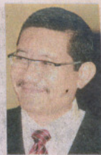
■ 天进行。 ■ 阿南依山：听證會分兩

他指出，有关听證會将由以雪州行政议长依斯干达为首的委员会主持，该委员会总共有9位成员。