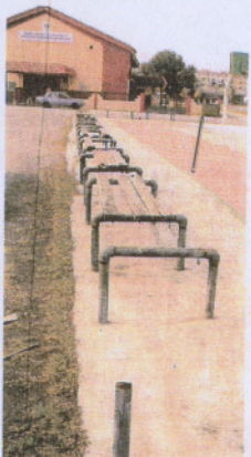
■大部分观众席板已腐蚀，一些木条已不见的铁框上只露出铁钉，威胁人们安全。