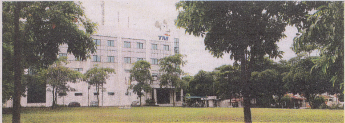
Subject of contention: Residents in USJ 6 are objecting to the proposed nine-storey office project on land belonging to TM Facilities.

"The previous assemblyman (referring to Datuk Lee Hwa Beng) had also made a statement saying