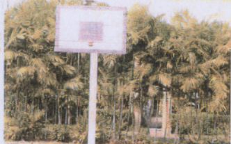
■市民感叹没篮框的篮框不能投