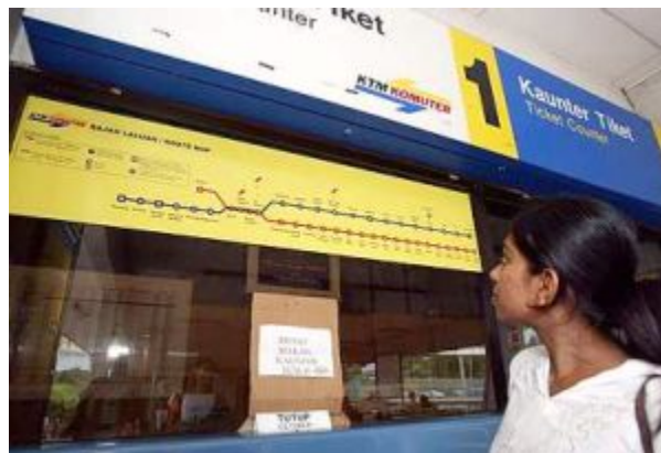
No service: Kumutham a/p Namasivayam looking at the sign at the ticket counter at KTM station.

A few KTM commuters contacted StarMetro to complain about the ticketing counters and told of how they were stranded at the stations.