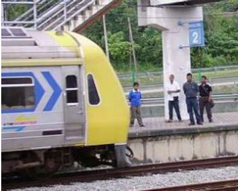
Komuter woes: Passengers waiting before boarding the train at a smaller station.

"Why doesn't KTM Komuter open the ticketing counter until about 7pm to cater for those coming back from work at peak hours?"