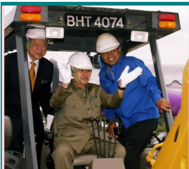
PECAH TANAH... Datuk Seri Abdullah Ahmad Badawi memandu jengkaut pada upacara Pecah Tanah Institut Kanser Negara di Presint 7 sambil diiringi Menteri Kesihatan Datuk Seri Dr Chua Soi Lek (kiri).

PUTRAJAYA, 9 Jan (Bernama) -- Datuk Seri Abdullah Ahmad Badawi hari ini membuktikan komitmen kerajaan menangani barah dengan melakukan upacara pecah tanah bagi pembinaan Institut Kanser Negara berharga RM340 juta di sini yang dijangka siap dalam tempoh dua tahun.