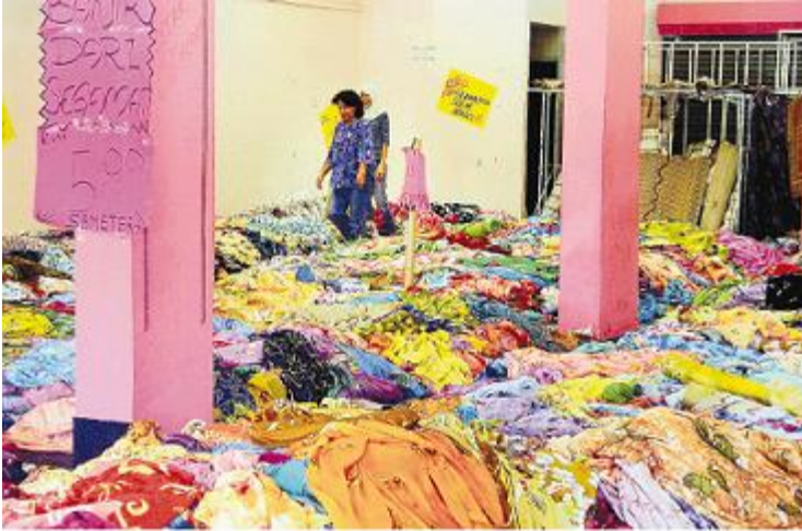
Textiles from a factory in Segamat, which was hit by floods, being put up for sale in Klang.

Abdullah said the Cabinet discussed the scheme last week following the floods which swamped Johor, Malacca, the east coast of Peninsular Malaysia and Sabah since Dec 18.