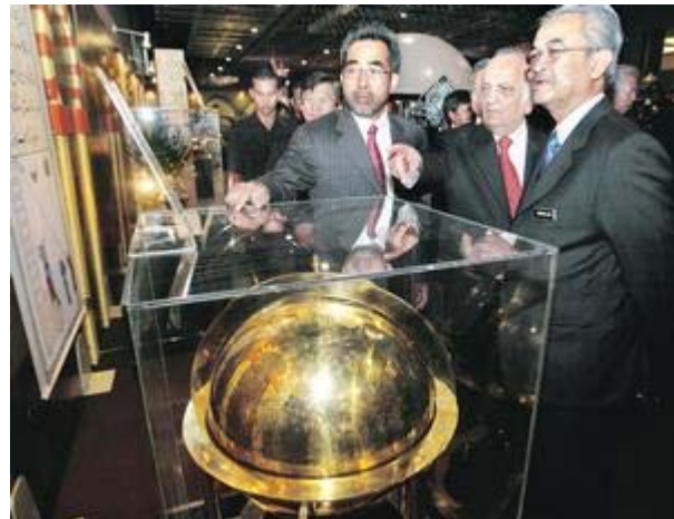
ABDULLAH Ahmad Badawi diberi penerangan oleh Dr. Fuat Sezgin (tengah) mengenai glob bumi dan pergerakan bintang sambil diperhatikan Dr. Jamaludin Jarjis pada majlis Pameran Kegemilangan Sains Dalam Tamadun Islam di Pusat Konvensyen Kuala Lumpur (KLCC), semalam.

Menurut Abdullah, adalah penting tenaga yang ada mempunyai keupayaan dari segi ilmu pengetahuan, kekuatan mental dan batin serta kesungguhan untuk mengejar kemajuan.