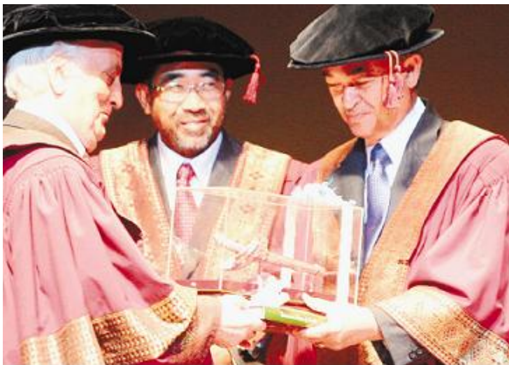
Datuk Seri Abdullah Ahmad Badawi presents the award and a souvenir to renowned historian in the fields of science and technology in the Muslim world, Prof Dr Fuat Sezgin (left) after launching the exhibition yesterday. With them is Science, Technology and Innovation Minister Datuk Seri Dr Jamaluddin Jarjis.

He was speaking at the launch of the Scientific Excellence in Islamic Civilisation Exhibition at the Kuala Lumpur Convention Centre yesterday.