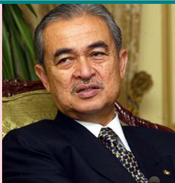
Perdana Menteri Datuk Seri Abdullah Ahmad Badawi.

Sumber / Tarikh: Berita Harian Online 9 Januari 2007 – Selasa