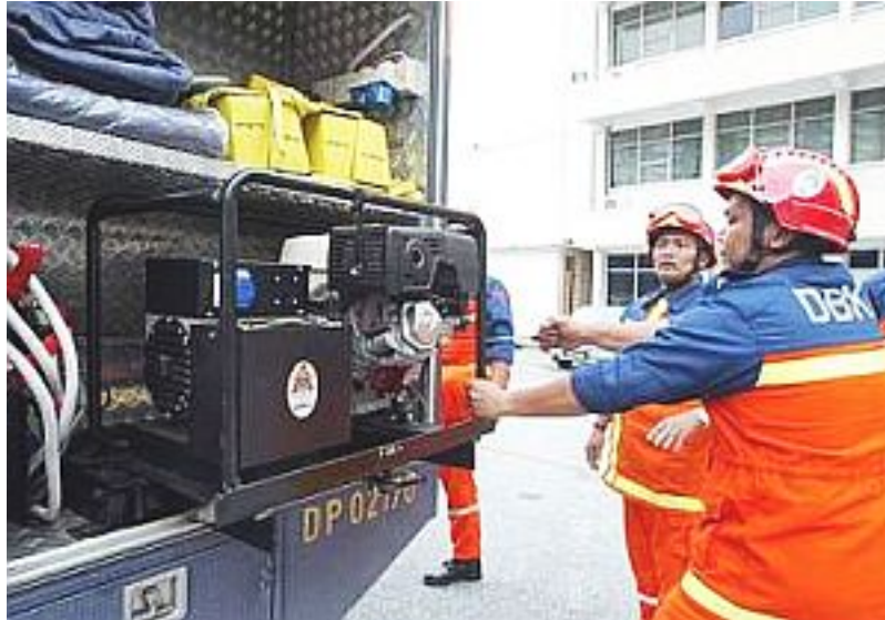
All set: Enforcement officers ensuring that all equipment is ready.

"We're not just talking about search and rescue, but ensuring that they (victims) gets the necessary support in terms of shelter, food, clothing and medical supplies," he said.