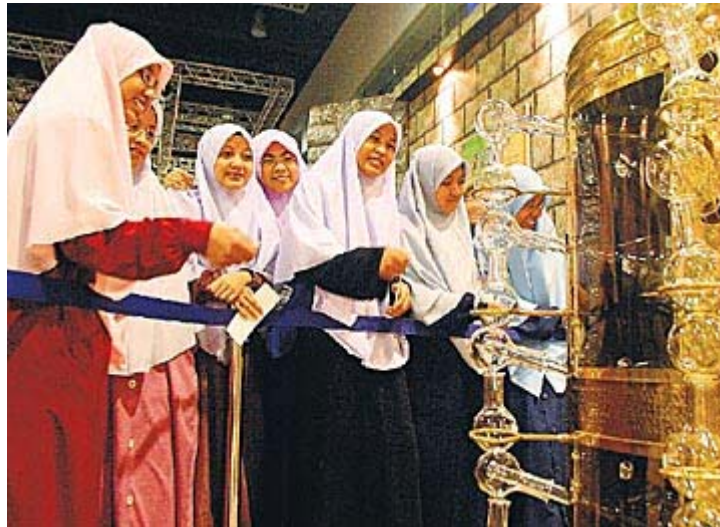
KEMAJUAN TEKNOLOGI ISLAM: Pelajar Darul Quran melihat alat penyulingan air mawar Al-Mizzah pada Pameran Sains Islam Mendahului Zaman di Pusat Konvensyen Kuala Lumpur, semalam.

KUALA LUMPUR: Kira-kira 5,000 pengunjung melawat Pameran Kegemilangan Sains Dalam Tamadun Islam pada hari pertama pameran di Pusat Konvensyen Kuala Lumpur (KLCC) semalam.