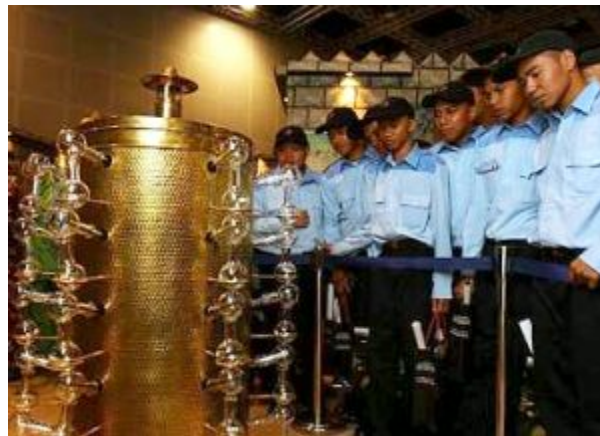
National service trainees from Kuala Langat's Paya Indah Camp looking at a water purifier at the exhibition on Monday.

"These are the groups who will be playing a major role in towards the development of the people and the nation as well as contributing to mankind," said Prime Minister Datuk Seri Abdullah Ahmad Badawi. He said the creation of such a community should be part of the country's social development plan.